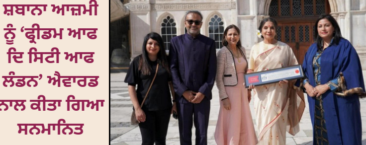
ਸ਼ਬਾਨਾ ਆਜ਼ਮੀ ਨੂੰ 'ਫ੍ਰੀਡਮ ਆਫ ਦਿ ਸਿਟੀ ਆਫ ਲੰਡਨ' ਐਵਾਰਡ ਨਾਲ ਕੀਤਾ ਗਿਆ ਸਨਮਾਨਿਤ

ਅਭਿਨੇਤਰੀ ਸ਼ਬਾਨਾ ਆਜ਼ਮੀ ਨੂੰ ਔਰਤਾਂ ਦੇ ਅਧਿਕਾਰਾਂ ਲਈ ਖੜ੍ਹੇ ਹੋਣ ਅਤੇ ਭਾਰਤੀ ਸਿਨੇਮਾ ਵਿੱਚ ਉਨ੍ਹਾਂ ਦੇ ਜ਼ਿਕਰਯੋਗ ਯੋਗਦਾਨ ਲਈ 'ਫ੍ਰੀਡਮ ਆਫ ਦਿ ਸਿਟੀ ਆਫ ਲੰਡਨ' ਦੇ ਖਿਤਾਬ ਨਾਲ ਸਨਮਾਨਿਤ ਕੀਤਾ ਗਿਆ ਹੈ। ਆਜ਼ਮੀ (73) ਨੂੰ ਸਰਵੋਤਮ ਅਭਿਨੇਤਰੀ ਲਈ ਪੰਜ ਰਾਸ਼ਟਰੀ ਪੁਰਸਕਾਰ ਅਤੇ ਛੇ ਫਿਲਮਫੇਅਰ ਪੁਰਸਕਾਰਾਂ ਨਾਲ ਸਨਮਾਨਿਤ ਕੀਤਾ ਗਿਆ ਹੈ। ਉਹ ਸਾਲਾਨਾ 'ਯੂਕੇ ਏਸ਼ੀਅਨ ਫਿਲਮ ਫੈਸਟੀਵਲ' (UKAFF) 'ਚ ਸ਼ਾਮਲ ਹੋਣ ਲਈ ਲੰਡਨ 'ਚ ਸੀ। ਸਿਨੇਮਾ ਵਿੱਚ ਉਨ੍ਹਾਂ ਦੇ 50 ਸਾਲ ਪੂਰੇ ਹੋਣ 'ਤੇ ਇੱਕ ਵਿਸ਼ੇਸ਼ ਪ੍ਰੋਗਰਾਮ ਦਾ ਆਯੋਜਨ ਕੀਤਾ ਗਿਆ। ਸ਼ਬਾਨਾ ਆਜ਼ਮੀ ਨੂੰ ਸਰਵੋਤਮ ਅਭਿਨੇਤਰੀ ਲਈ ਪੰਜ ਰਾਸ਼ਟਰੀ ਪੁਰਸਕਾਰ ਅਤੇ ਛੇ ਫਿਲਮਫੇਅਰ ਪੁਰਸਕਾਰਾਂ ਨਾਲ ਸਨਮਾਨਿਤ ਕੀਤਾ ਗਿਆ ਹੈ। ਲੰਡਨ ਵਿੱਚ ਸਨਮਾਨ ਪ੍ਰਾਪਤ ਕਰਨ ਤੋਂ ਬਾਅਦ, ਉਸਨੇ ਕਿਹਾ, 'ਮੈਂ ਲੰਡਨ ਦੀ ਸਿਟੀ ਆਫ ਲੰਡਨ ਪੁਰਸਕਾਰ ਪ੍ਰਾਪਤ ਕਰਕੇ ਬਹੁਤ ਮਾਣ ਮਹਿਸੂਸ ਕਰ ਰਹੀ ਹਾਂ। ਇਹ ਸਿਨੇਮਾ ਅਤੇ ਸਰਗਰਮੀ ਦੀ ਸ਼ਕਤੀ ਦਾ ਪ੍ਰਮਾਣ ਹੈ ਕਿ ਅਸੀਂ ਸੀਮਾਵਾਂ ਨੂੰ ਪਾਰ ਕਰਨ ਅਤੇ ਸਮਾਜ 'ਤੇ ਸਾਰਥਕ ਪ੍ਰਭਾਵ ਪਾਉਣ ਦੇ ਯੋਗ ਹਾਂ।'